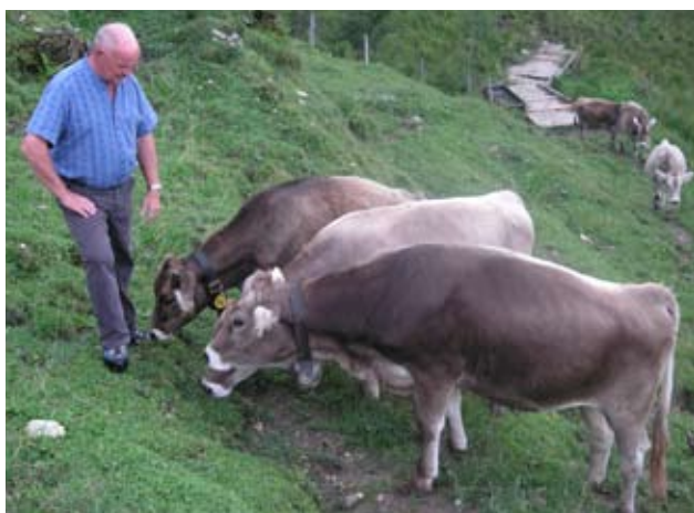
Vom Hauswart zum Alp-Meister